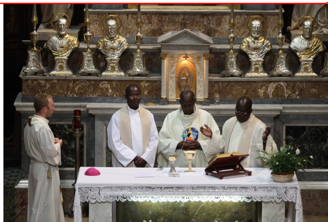
Messa col vescovo rwandese Serville Zakamita