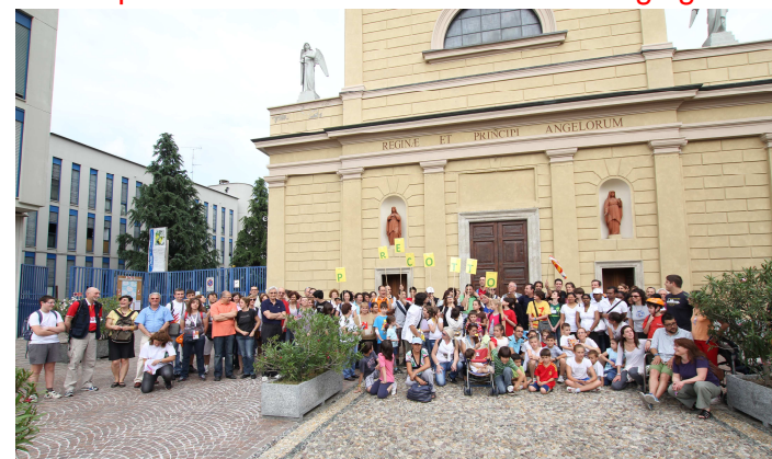
Partenza per l'incontro col Papa - 2 giugno