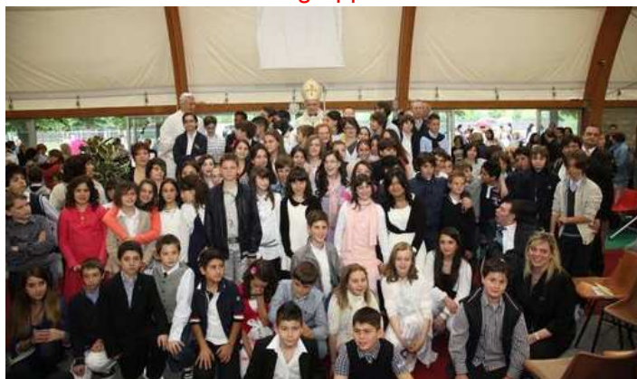
Cresimati - sabato 19 maggio