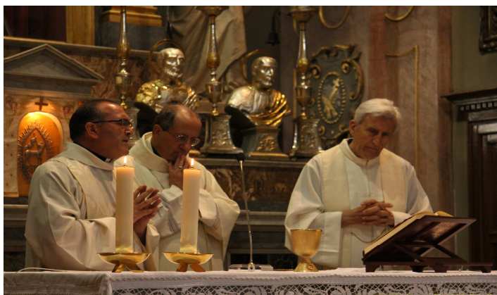
Il vescovo di Chieti-Vasto Bruno Forte - sabato 2