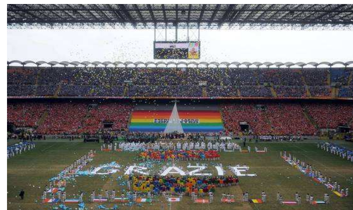
Il Papa coi cresimati a S. Siro - sabato 2 giugno