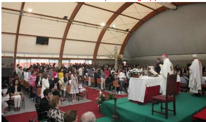
Cresimati dal vescovo Luigi Stucchi