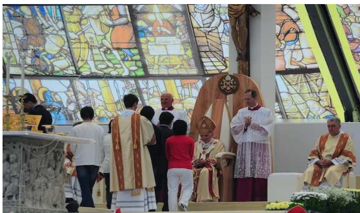
Altare family 2012