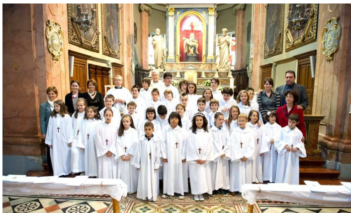
Comunioni: 25 aprile - 1° gruppo